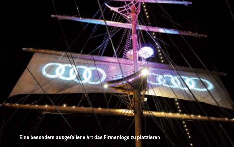
Eine besonders ausgefallene Art das Firmenlogo zu platzieren